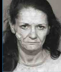
Stejná uživatelka o dva a půl roku později

„M ůj život se vymkl kontrole po obyčejné dámské jízdě, kterou jsem chtěla zahnat nudu. Tři roky poté, co jsem byla ve věku čtyřiceti let poprvé seznámena s pervitinem, jsem si drogu píchala. Opustila jsem manžela a tři děti (10, 12 a 15) a skončila na ulici.“