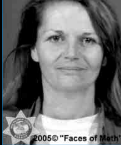
Uživatelka pervitinu v roce 2002

Z toho plyne, že se jedná o jednu z nejtěžších drogových závislostí — alespoň z hlediska léčení — a řada lidí umírá v její pasti.