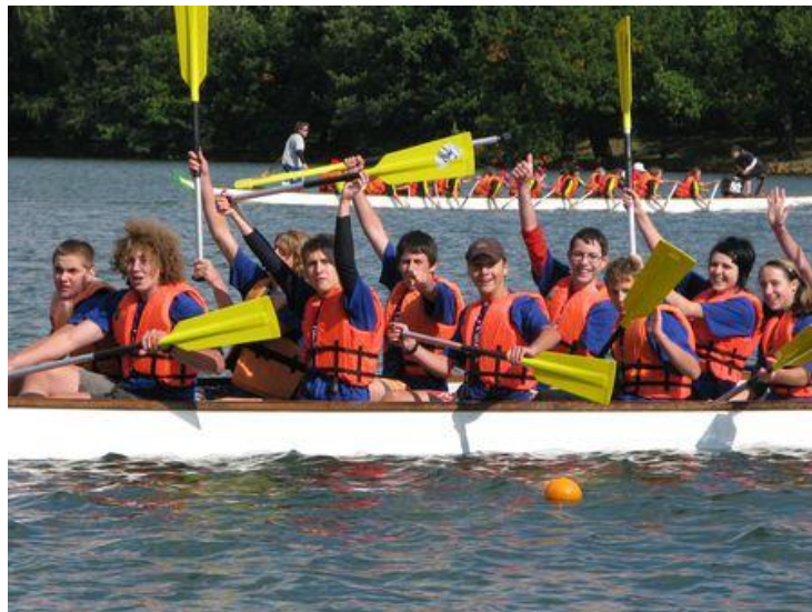
Naše vítězná loď v soutěži dračích lodí na Kamencovém jezeře