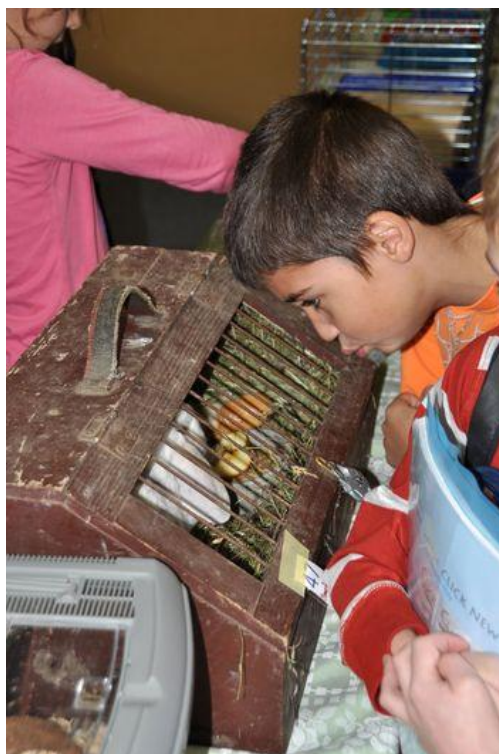
Školní výstava domácích mazlíčků