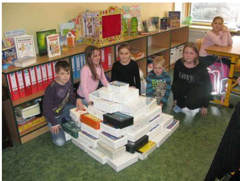
Žáci se zapojili do mnoha humanitárních aktivit, sběr lékárníček pro Afriku