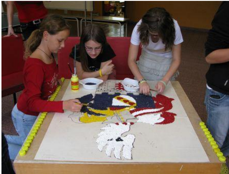
Žáci školy se zapojili do celorepublikového projektu výroby erbu města z recyklátu