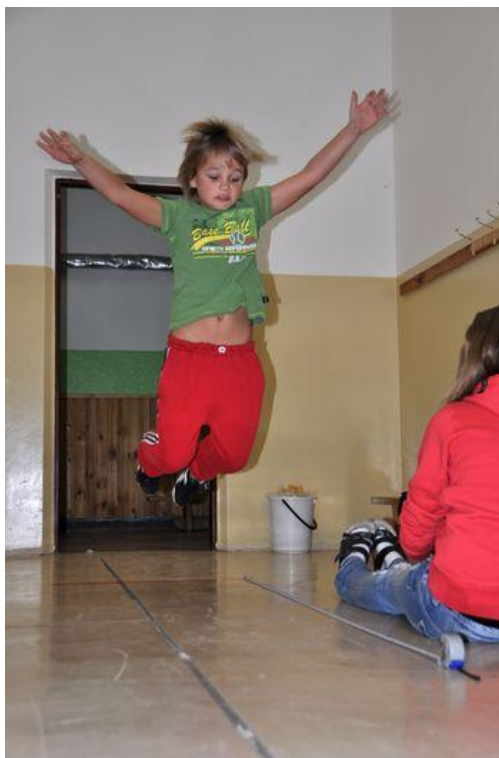
Školní miniolympiáda – starší žáci pořádali pro malý stupeň