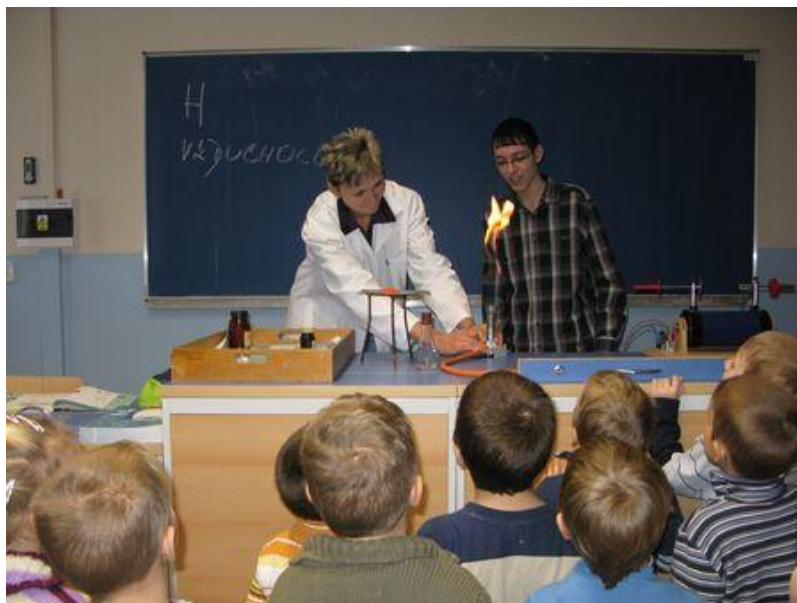
Děti z partnerské MŠ na hodině chemie