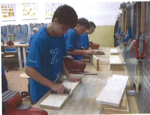
Pracovní činnosti probíhají v nově zařízených dílnách.

Donutit zodpovědné pracovníky města k vytvoření jasné koncepce ohledně dalšího fungování školního bazénu – rekonstrukce či změna v tělocvičnu? Vedení školy činí vše pro to, aby bazén zachránilo.