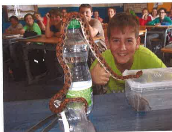
Názornost ve výuce především! Hodina přírodopisu.